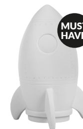
IDE-60002 LED KIDS LAMP ROCKET