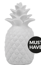
IDE-60001 | IDE-60033 LED KIDS LAMP PINEAPPLE