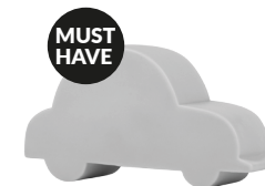
IDE-60017 LED KIDS LAMP CAR