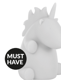
IDE-60018 LED KIDS LAMP UNICORN