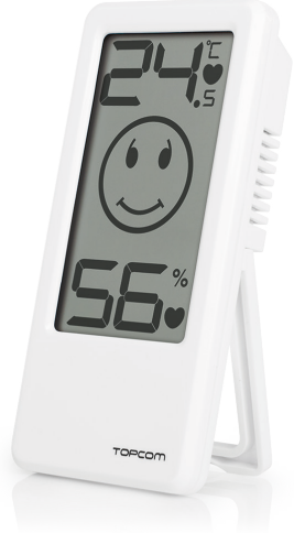
TOPCOM BEBEK KONFOR TERMOMETRESİ MODEL: TH-4675