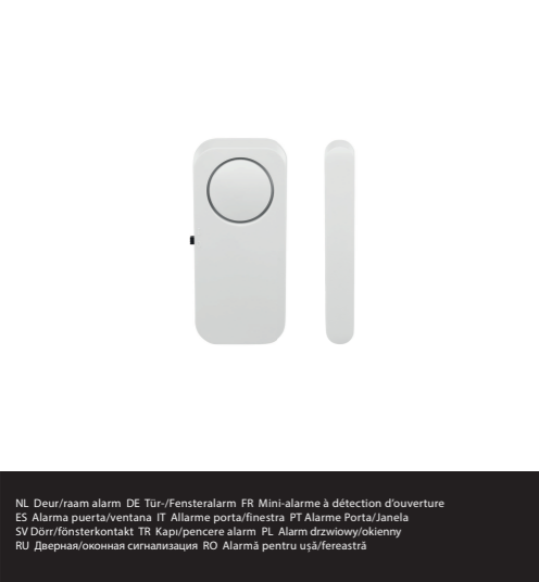
NL Deur/raam alarm DE Tür-/Fensteralarm FR Mini-alarme à détection d'ouverture ES Alarma puerta/ventana IT Allarme porta-finestra PT Alarme Porta/Janela SV Dörrfönsterkontakt TR Kapı/pençere alarm PL Alarm drzwiowy/okienney RU Дверная/Оконная сигнализация RO Alarmă pentru ușă/ferestăra