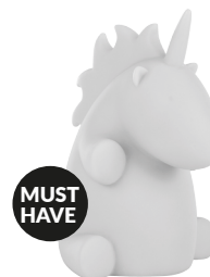
IDE-60018 LED KIDS LAMP UNICORN