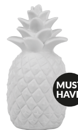
IDE-60001 | IDE-60033 LED KIDS LAMP PINEAPPLE