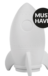
IDE-60002 LED KIDS LAMP ROCKET