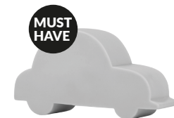
IDE-60017 LED KIDS LAMP CAR